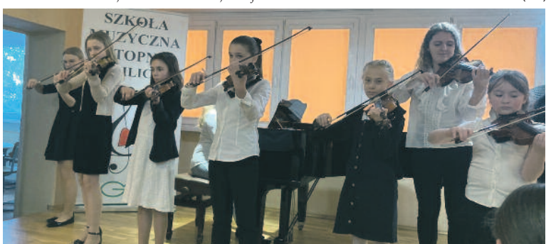
FOT. SZKOŁA MUZYCZNA I ST. W MILICZU