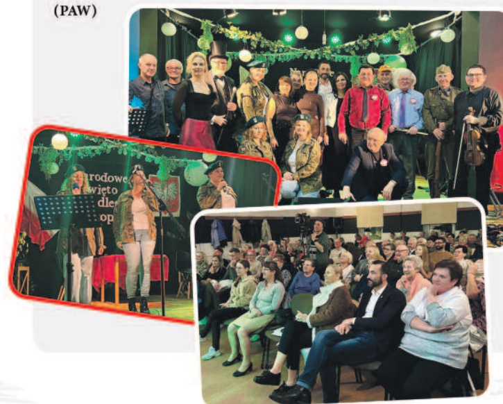
Fot. Wojciech Piskozub - Burmistrz Gminy Milicz