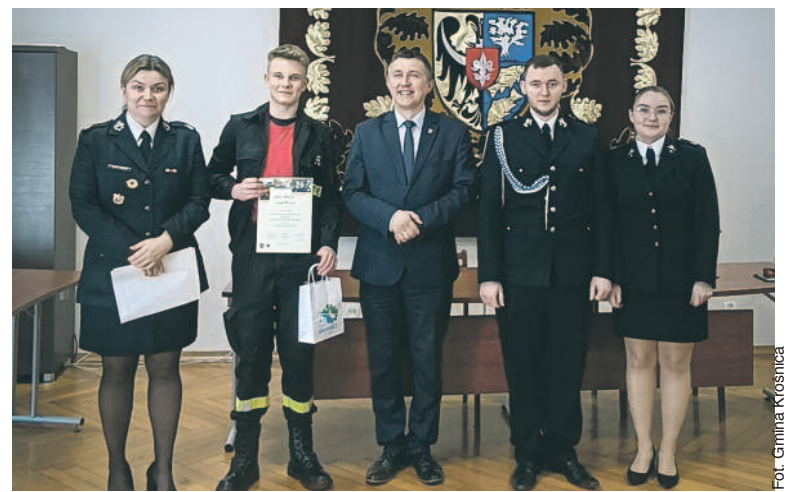
Fot. Gmina Krośnice