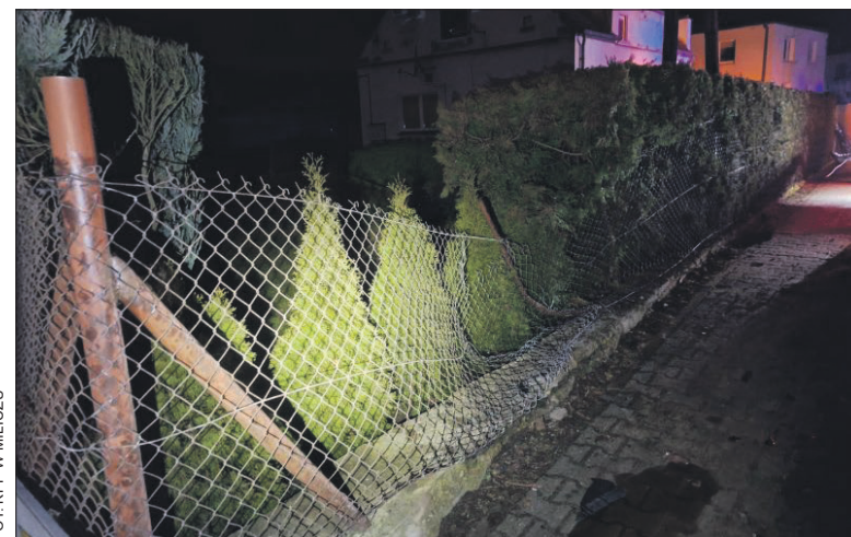
FOT. KPP W MILICZU

Interwencja po zdarzeniu drogowym w Miliczu ujawniła, że sprawca kolizji miał do odbycia karę pozbawienia wolności.