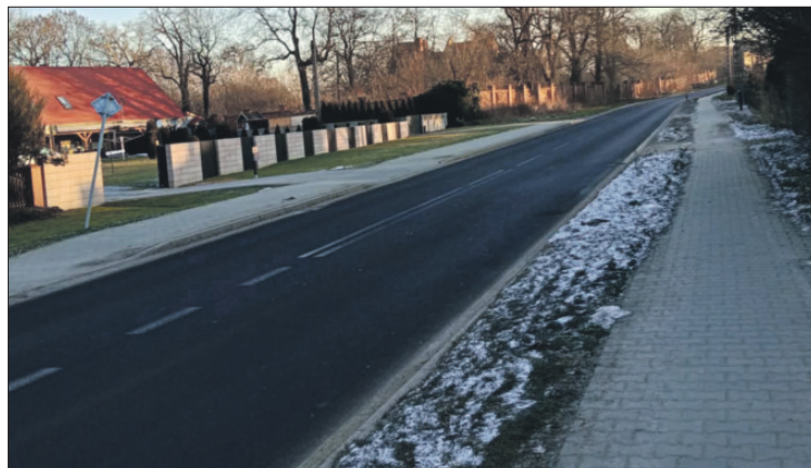
na zdjęciu droga, którą prowadzono jeńców oraz krzyż, obok którego zabito jednego z nich