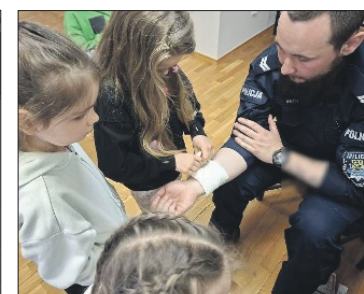
KPP W MILICZU