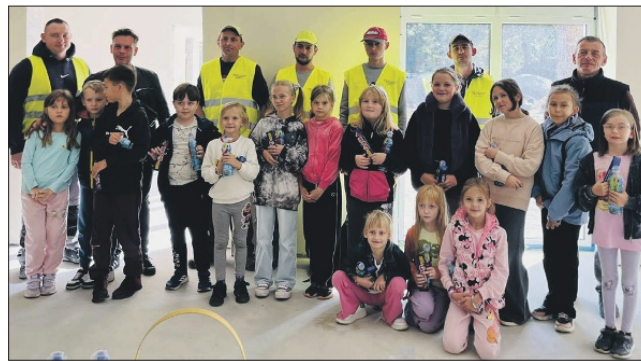
FOT. CHATKA PUCHATKA ŚSOPS W MILICZU | GMINA MILICZ